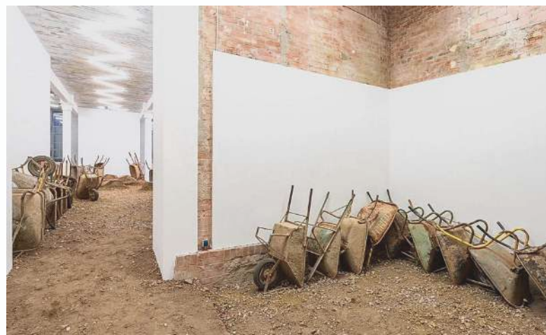
Blick in die Ausstellung „Vanishing Points, 2014–2020“ von Ibrahim Mahama, der 100 Schubkarren aus Ghana in die Galerie Reiter gebracht hat.