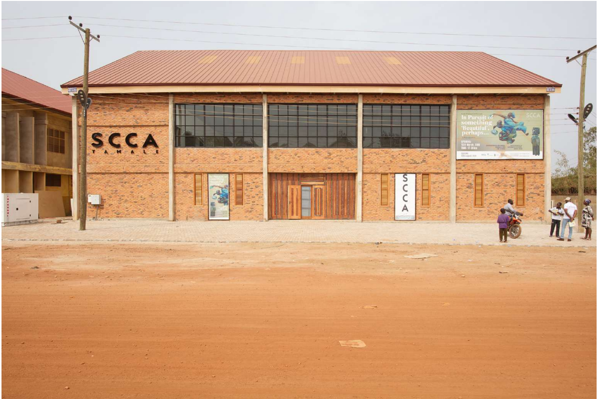
SCCA – The Savannah Centre for Contemporary Art