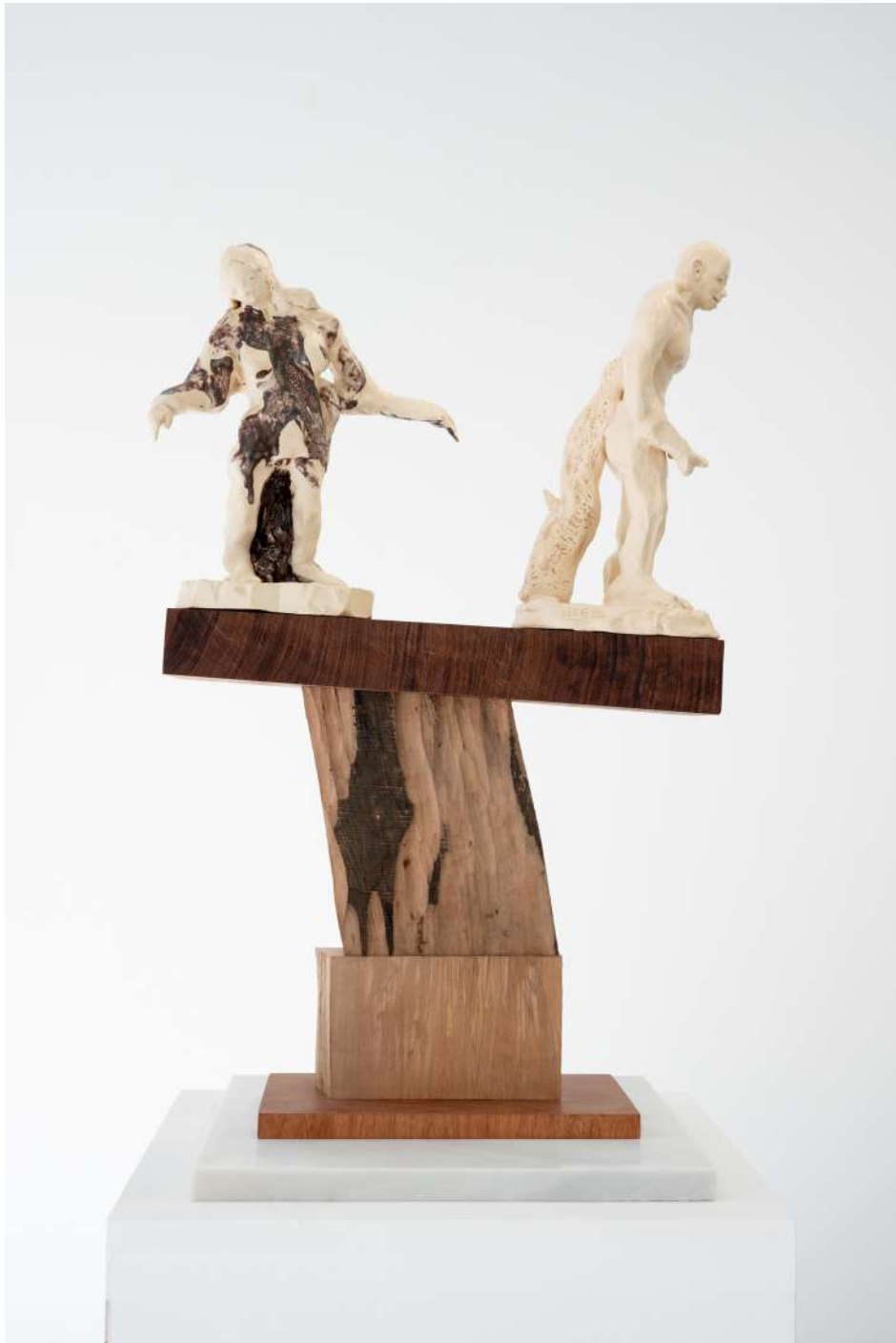
MONUMENT FOR THE ONES WHO COULD LICK THEIR NOSE BUT EAT FRENCH FRIES INSTEAD, 2019 Glasierte Keramik, teils farbig gefasstes Birnenholz | glazed ceramics, partly color set pear wood 62 x 30 x 27 cm 6.800 EUR