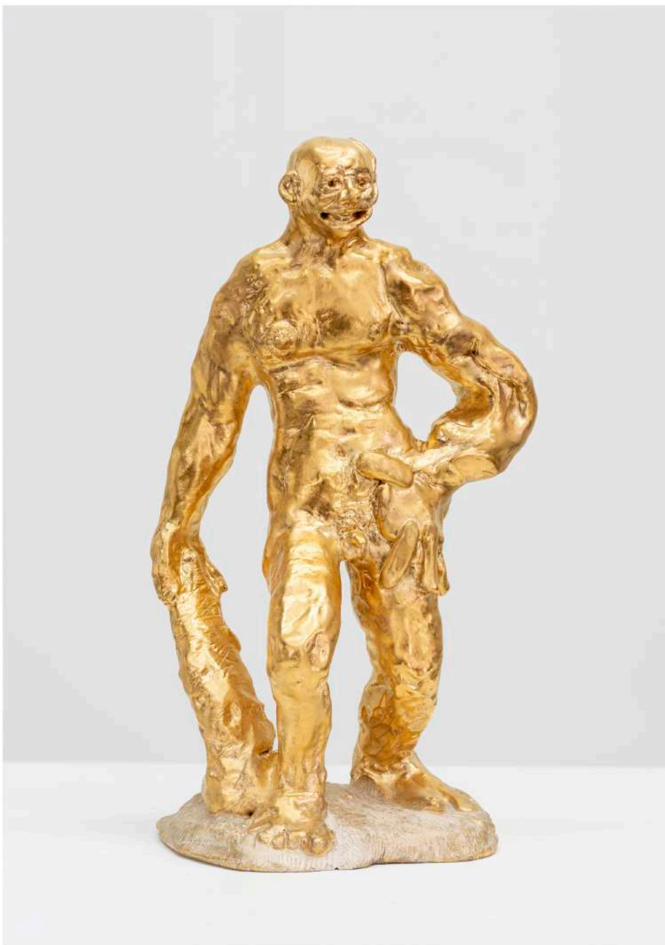
COCKMAN CLAIMS HE CAME FIRST, THEN THE CHICKEN, THEN THE EGG, 2022 glasierte und teilvergoldete Keramik, Sandstein, diverse Hölzer (Birne, Jatoba), Lack, Beize | glazed and partially gold-plated ceramic, sandstone, various woods (walnut, pear, jatoba), lacquer, stain 37,5 x 37 x 20,5 cm 4.800 EUR