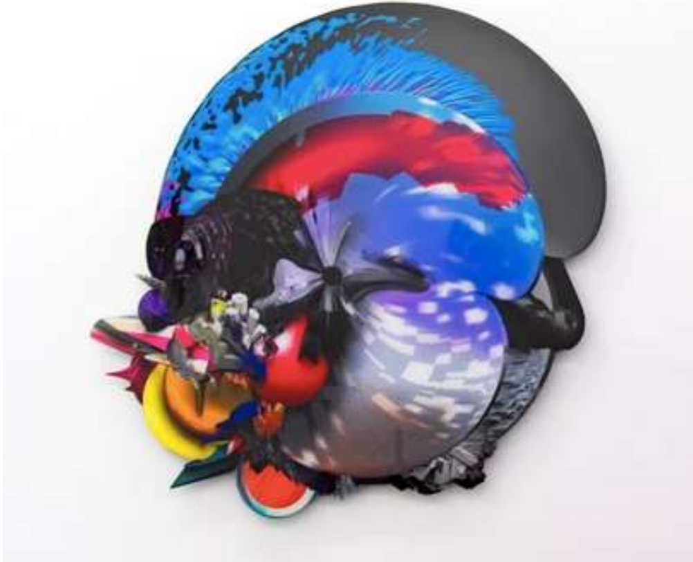
CIRCULAR, 2012 Metallic-Fotopapier, Diasec (Acrylglasplatte, Aluminiumrahmen) | metallic Photo Paper, Diasec (Acrylic sheet, Aluminum frame) 59,5 x 58 cm 2.200 EUR