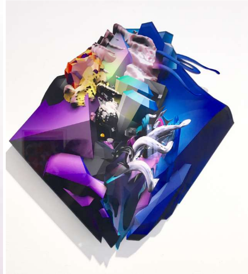
RHOMBUS, 2013 Metallic-Fotopapier, Diasec (Acrylglasplatte, Aluminiumrahmen) | metallic Photo Paper, Diasec (Acrylic sheet, Aluminum frame) 60 x 59 cm 2.200 EUR