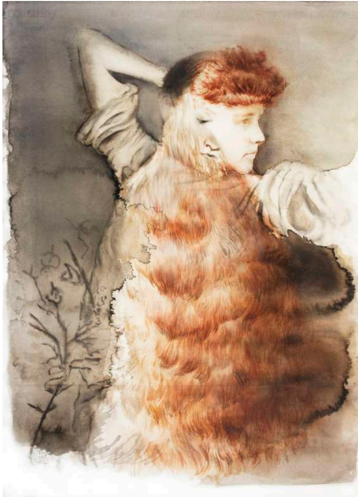
DARWIN'S PRIDE, 2018

Aquarell, Gouache, Bleistift und Farbstift auf Papier | watercolor, gouache, pencil and colored pencil on paper 76 x 56 cm